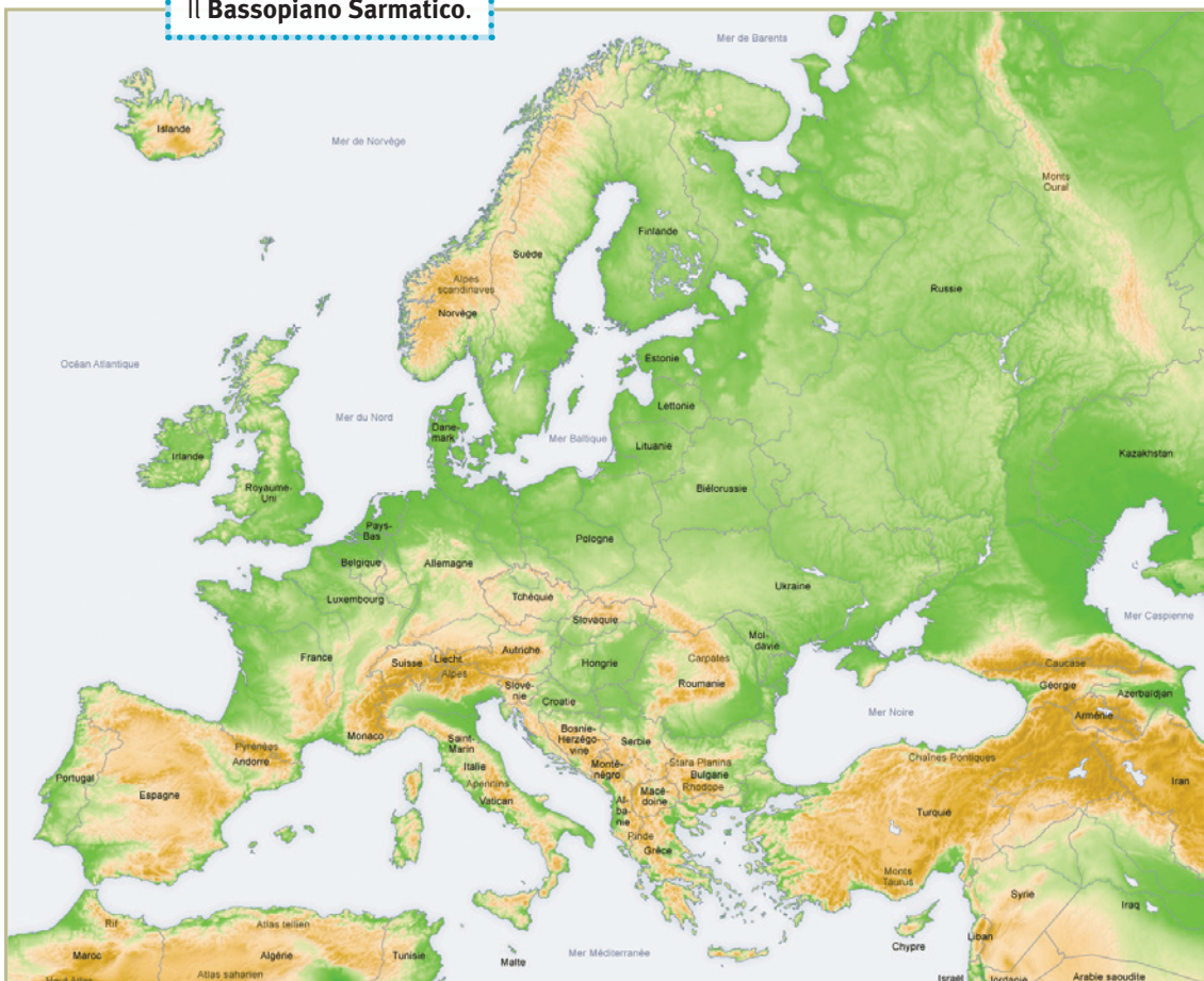
Il Bassopiano Sarmatico.

più antica formazione geologica in Europa, risalente a centinaia di milioni di anni fa e resa un altopiano pianeggiante dall'azione prolungata degli agenti atmosferici e dei ghiacciai, che nel corso delle glaciazioni hanno spianato i rilievi e riempito di detriti le depressioni. Ad lati, soprattutto verso i fiumi, si trovano alcuni rilievi, come quelli lungo il Don e il Volga. Si tratta di zone molto fertili, particolarmente adatte all'agricoltura.